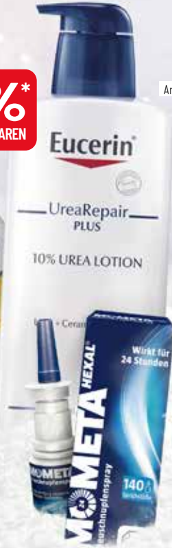
Artikel S. 7